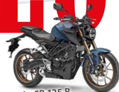
Honda CB 125 R