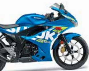
Suzuki GSX-R 125