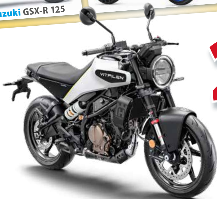
Husqvarna Vitpilen 125