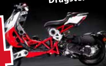
Italjet Dragster 125