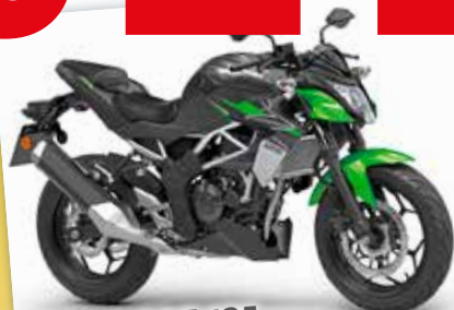
Kawasaki Z 125