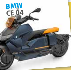
BMW CE 04