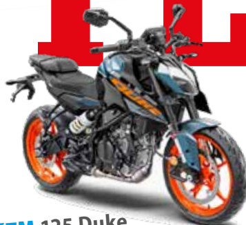
KTM 125 Duke